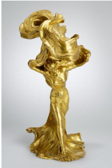
Asztali villanylámpa - A fátvoltáncosnő (Loie Fuller)