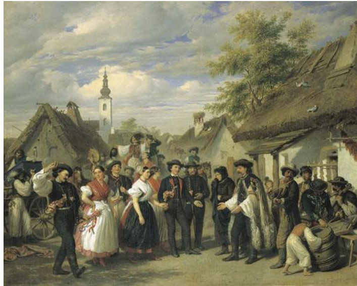
Barabás Miklós: A menyasszony megérkezése (Magyarország) 1856

Készült: olaj, vászon; mérete: 127 x 159 cm Megtekinthető: Magyar Nemzeti Galéria, Állandó kiállítása (B-C épület, I. emelet)